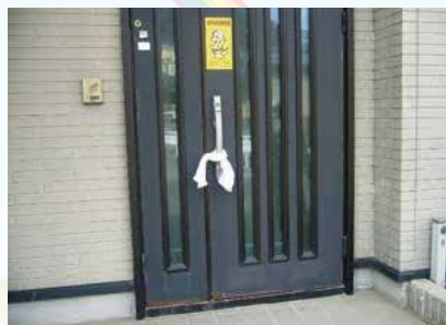
▲避難表示済（玄関先に黄色いタオルを表示）