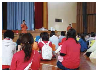
▲消防職員による防火講話

火で十分消火できる火災規模であることを学んだ上で、消火器の取扱訓練も行っている。防火・防災の基礎を学び、自分の家を火災から守れるようになり、さらにそこから視野を広げ近所同士で助け合う共助の知識を身に付けていくなど、段階的に学ぶことができる防火・防災教育の普及に努めている。