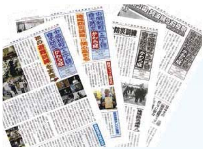
▲地域の人達の手で防災かわら版を発行

は音楽コンサートを企画し、地元の大学生もサークル活動を通して地域の人達と交流し、一体感作りの役割を果たしている。また、防災かわら版の発行により、地域の人達に防災や身近な地域の情報を伝え、地域の一体感や共有感を図ると同時に、住民の顔写真を掲載して紹介することで、交流のきっかけとなり、互いに助け合えるまち作りの一助となっている。