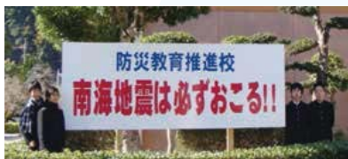
▲潮江中の正面玄関に大看板掲示