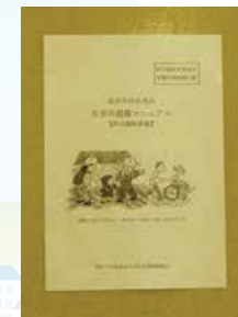
▲災害時避難マニュアル（表紙）