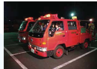
▲消防団と火災予防広報の様子