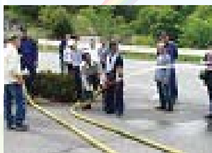
▲リーダー研修会放水体験の様子