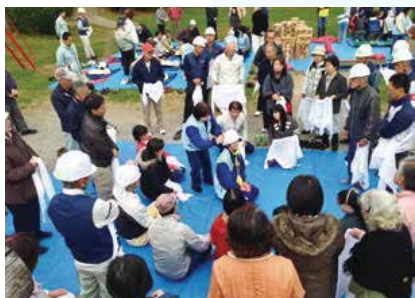
▲参加者全身体験型防災訓練の様子