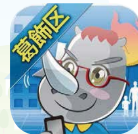
▲防災学習アプリ「天サイ!まなぶくん」