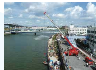
▲連合町会・消防・区ボート浮艇操船訓練