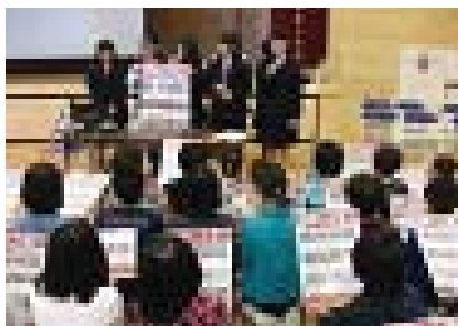
▲「地震に注意」のポスターを活用しての小学校へ出前授業の様子

トさせた。全学年で地震や津波についての学習を進める「防災プロジェクトチーム」を結成、生徒が中心となって南海トラフ地震啓発ポスター「地震に注意!!」を作成し、校区内の保育園、幼稚園、小学校に配布した。また、「防災プロジェクトチーム」を中心とした出前授業や、全校生徒により校区の高齢者を支援しながら学校近くの山等に逃げる避難訓練を実施している。