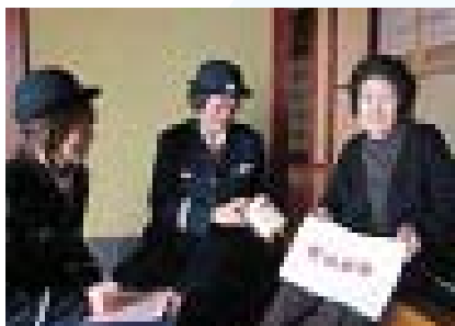
▲一人暮らし高齢者家庭防火訪問