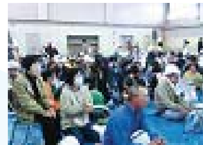
▲避難所体験の様子 「高齢者が多数！」