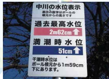
▲新小岩各地域に設置された水位表示盤