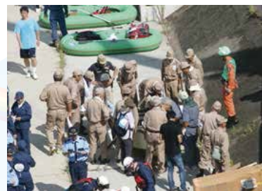
▲消防と連合町会のボート組立て訓練

また、東京大学等に働きかけGPSと連動した水害時の水位や地震時の危険度等の防災情報が簡単に分かるスマートフォン向け防災学習アプリの葛飾区版を開発し、「天サイ!まなぶくん」を使ったまちづくりイベントも同時に開催している。大規模災害を想定した防災訓練は、東京消防庁本田消防署、葛飾区の全面協力により地元消防団と町会・市民消防隊が連携して実践的で組織的な自助・公助・共助体制の確立を図り、地域の防災行動力のさらなる向上に努めている。