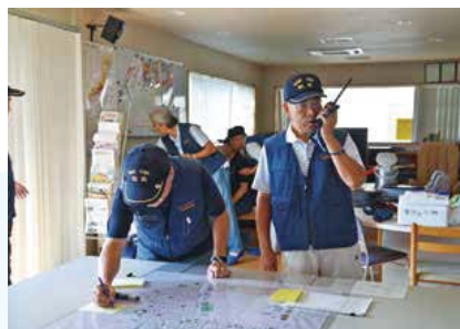
▲簡易無線機による情報収集訓練の様子