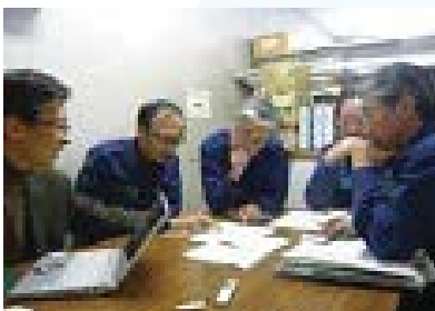
▲東日本大震災被災地（千葉県浦安市）支援の様子（平成 23 年 3 月）