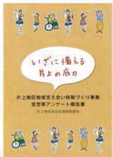
支え合い体制づくり▶ アンケート報告書