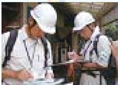
▲台風 9 号被災地（静岡県小山町）支援の様子（平成 22 年 9 月）