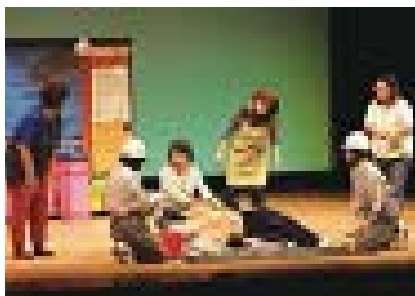
▲富山県老人若返り祭り芸能大会（寸劇）の様子

きることを考え、高齢者家庭への防火に関する訪問や各種団体に向けた防火啓発の寸劇、子供たちへの防火教室を行っている。また、更なる防火意識の向上を図るため、広報誌の発行及び火災予防に関する情報をまとめたホームページを作成している。