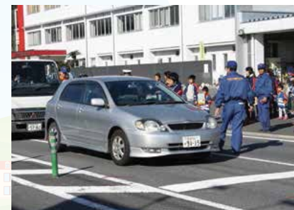
▲信号待ちのドライバーに住宅用火災警報器のチラシを配布している様子