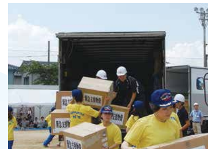
▲大学生消防団員（防災サポーター）の訓練の様子