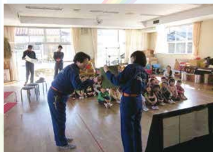
▲子供たちへの防火教室