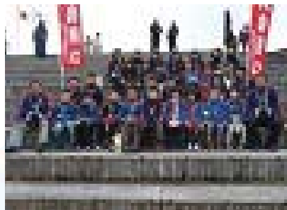
▲消防団の出初め式に参加の様子

ない。こうした取り組みから、園児から小学校6年生までの縦のつながりができ、青少年健全育成に役立つとともに、地域の方々とふれあいを持つ機会が多くなり、「地域から愛される」存在となっている。また、結成以来28年以上継続しているため、結成当初のクラブ員が大人になり、自分の子供にも火災予防の重要性を伝授している。