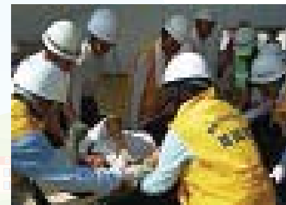
▲自主防災組織による防災訓練の様子