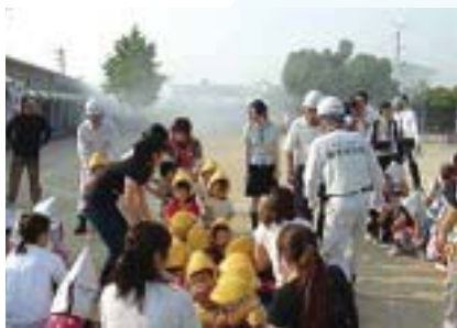
▲企業と防災会連携かけつけ訓練による保育所児童避難支援の様子