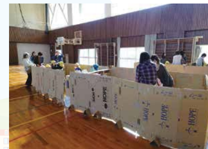
▲ダンボール避難所生活体験訓練の様子