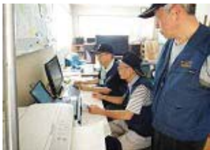
▲ PC による情報収集と伝達訓練の様子

含めて統制できるよう地域ブロック制を導入。また、簡易無線機や携帯電話・スマートフォンの活用、災害発生時の防災センターの設置などIT技術の活用と体制を整備。情報収集と指示・発信ができる体制の構築を目指し、ITツール利用のための講習会や訓練などにも積極的に取り組んでいる。