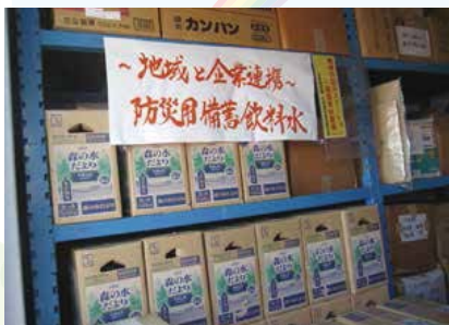
▲企業倉庫を活用した防災用備蓄の模様