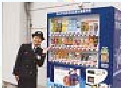
▲消防団員応援自動販売機