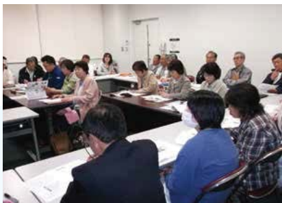
▲地域減災リーダー育成