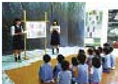
▲潮江中のある防災展示館の活用の様子