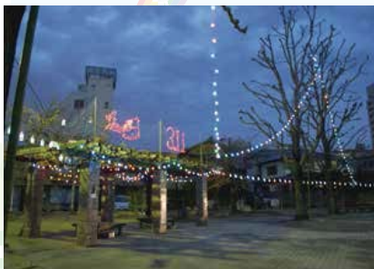
▲冬の灯りイベント／建築士会の協力