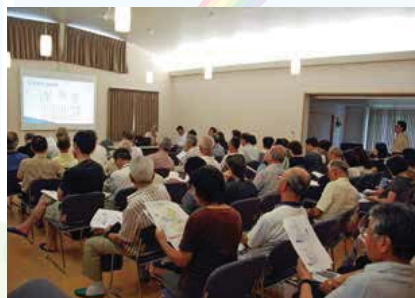
▲自主防災会防災講習会の様子