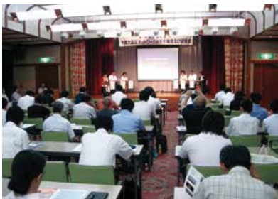
▲総会及び研修会の様子（平成 25 年 8 月）

害対応のノウハウを学ぶ意思のある自治体を会員とし、会員自治体が被災した場合には即座に応援活動を開始する。しかしながら、あくまでインフォーマルな組織であり、強制的に応援をする義務はなく、自治体の事情に合わせ緩やかなきずなで広域応援活動を行っている。