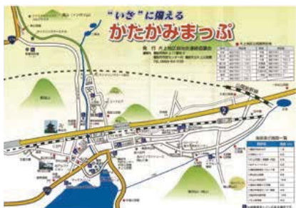
▲“いざ”に備える かたかみまっぷ

の講座をはじめ、放水、簡易担架づくりなどの実地訓練を実施している。活動の経験が市内の他の地区へと広がりを見せ、本年度の防災訓練は市域の80%の地域で実施される見込みとなり、主体的な役割を果たしている。