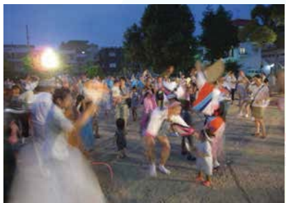
▲昭和公園で阿波踊り前夜祭／徳島文理大学の踊り