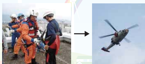
▲高知市防災訓練への参加