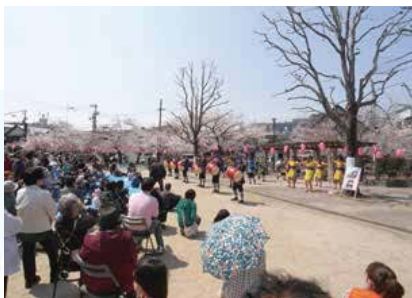
▲地域の公園で春の交流イベント／徳島文理大学のエイサー踊り