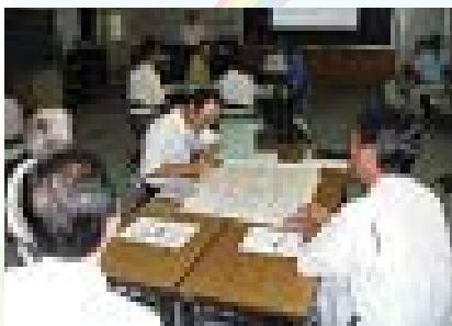
▲避難所施設利用の合意形成