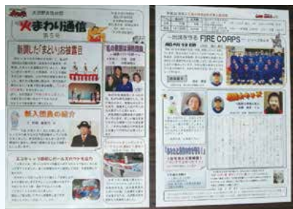
▲大沢野女性分団広報誌「火まわり通信」