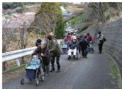
▲隣近所が声を掛け合いグループごとの避難状況

約2年の歳月を要し、その間も高台への津波避難の実施検証を繰り返し行なった。「向う三軒両隣」を旨とした共助の精神を基本として、「グループ避難方式」を確立することで避難漏れを無くす取り組みを行っている。