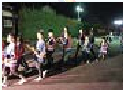
▲地区内の「火の用心」を拍子木を鳴らし呼びかけている様子