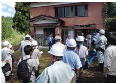
▲住家の被害認定調査実地研修会の様子（平成 25 年 10 月）