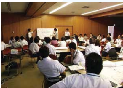
▲避難所開設機能の研修