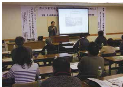
▲ささえあいフォーラムの様子