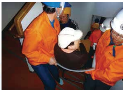
▲要援護者の救助 階段を吊り上げる様子

者カード」を民生・児童委員、福祉協力員の協力のもと作成した。また、要配慮者を確実に支援することを目指した防災訓練の実施や、住民向けの実践型避難所運営訓練に加えて、避難所運営図上訓練(HUG)を導入し、住民、企業、ボランティア団体、行政による自主防災活動の推進を図っている。