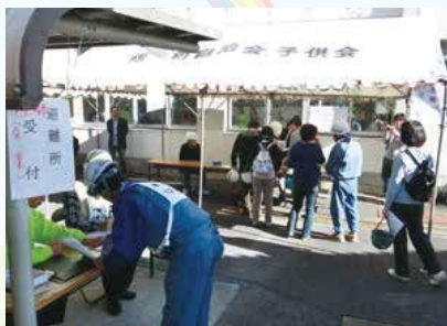
▲避難所運営訓練の様子 「企業とともに！」