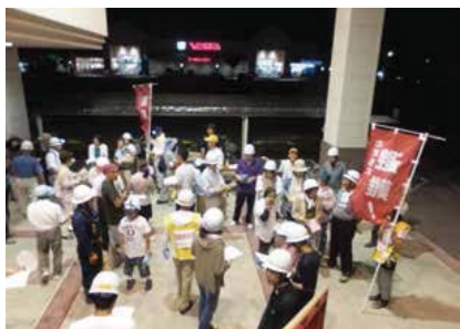
▲民間避難所を利用した夜間避難訓練の様子

けた。各企業の状況に応じレベル 1～3 まで段階的に進める中で、互いの連携を深めることが、地域防災力向上につながると考え、時間をかけながら機会があるごとに企業経営者と話し合いを行った。その結果、相互支援や一次避難所の協定締結等の成果が生じている。