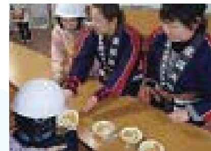
▲非常食試食の様子