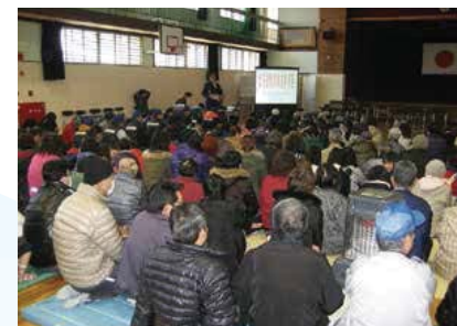
▲避難訓練の後、検証会を行い避難マニュアルを作成