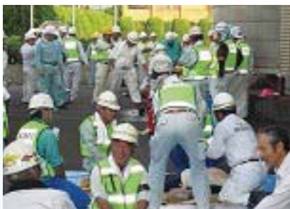
▲地元建設会社との合同防災訓練の様子