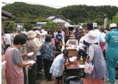
▲減災力向上の出前塾

防災計画に基づいた「地域減災リーダー育成」や「機能する自主防災組織づくり」への規定や訓練計画のソフト整備に取り組んでいる。さらに、緊急時に避難所施設を利用する住民側と施設管理側とで施設利用の合意形成をすすめ、避難所の開設機能を習得する中で地域コミュニティの向上を図っている。