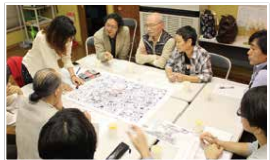
協同建替ワークショップ

「わいわい会」として発足し、課題や夢を語っていましたが、事業をすすめるにあたり、より地域コミュニティーとの連携が必要とされ、地域内の6町会とわいわい会で構成する「一言会を防災のまちにする会(通称 一言会)」へと発展しました。