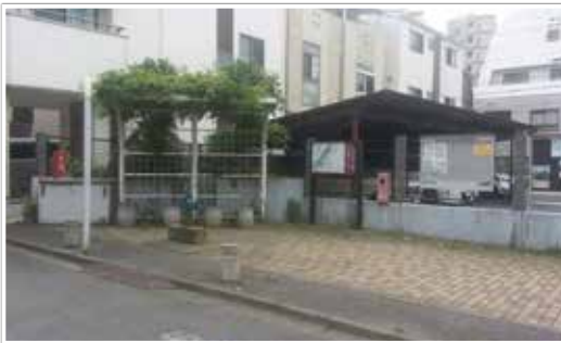
路地尊 5号基 (広場名 はとほっと)

命名にあたっては「路地で培われた隣近所関係を尊ぼう」という気持ちが込められています。この他にも避難時に活用される街路の修景やポケット広場の整備をおこないましたが、計画の段階から隣近住民と進めることにより、完成後も施設の維持管理について、地域の皆さんが見守っていただいています。