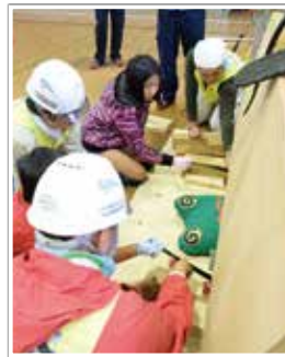
ジャッキアップを学ぶ子ども

その後、調査活動等の活動を継続的に進めて来ましたが、このような活動の中から、子ども達の防災意識を育てようと、2009年(平成21年)から「イザ!カエルキャラバン!」を実施してきました。持ち寄ったおもちゃの換えっこをしながら楽しく防災知識を体験しようとするイベントです。毎回、地元の消防団を初め、地域を元気にしようと頑張る様々なグループとともに企画・実施をしています。また、近年では、空き家が目立ち始めたまちの中で、近隣が協同して建て替える計画を地主さんとも考えています。