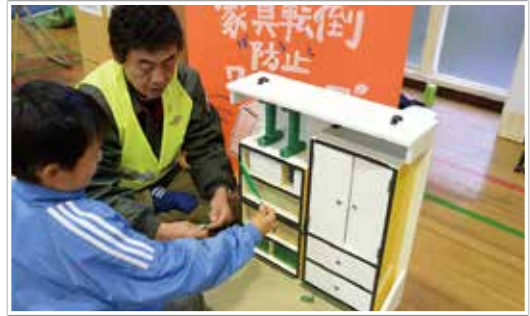
寝具転倒防止を学ぶ子ども達

このような活動を進めて10年目に「防災まちづくり大賞」というご褒美をいただきました。