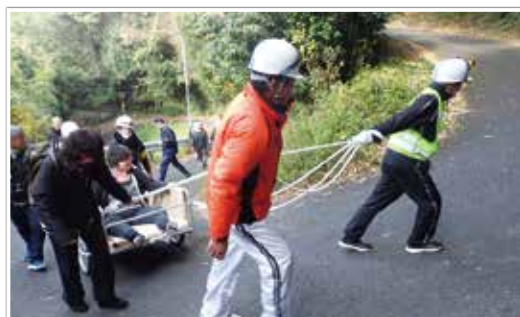
写真2 ステップ⑥インクルーシブ防災訓練