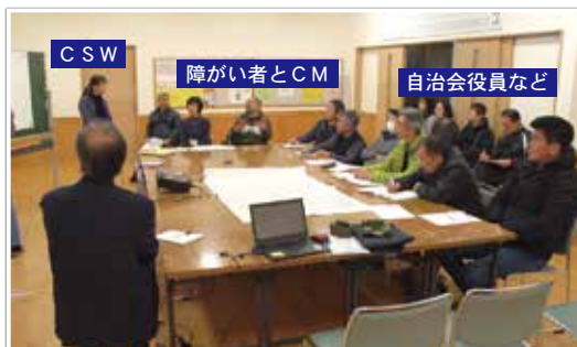
写真1 ステップ④避難調整会議

避難行動時の写真にありますようなりヤカーの活用は、この時住民との調整会議で導き出されたものです（写真2）。