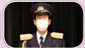
新たな発展への決議を述べる三輪和夫日本消防協会理事長