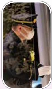
総務大臣代理横田真二消防庁長官