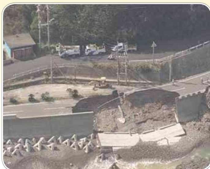
鹿児島県南さつま市