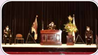
秋本敏文日本消防協会会長の主催者挨拶